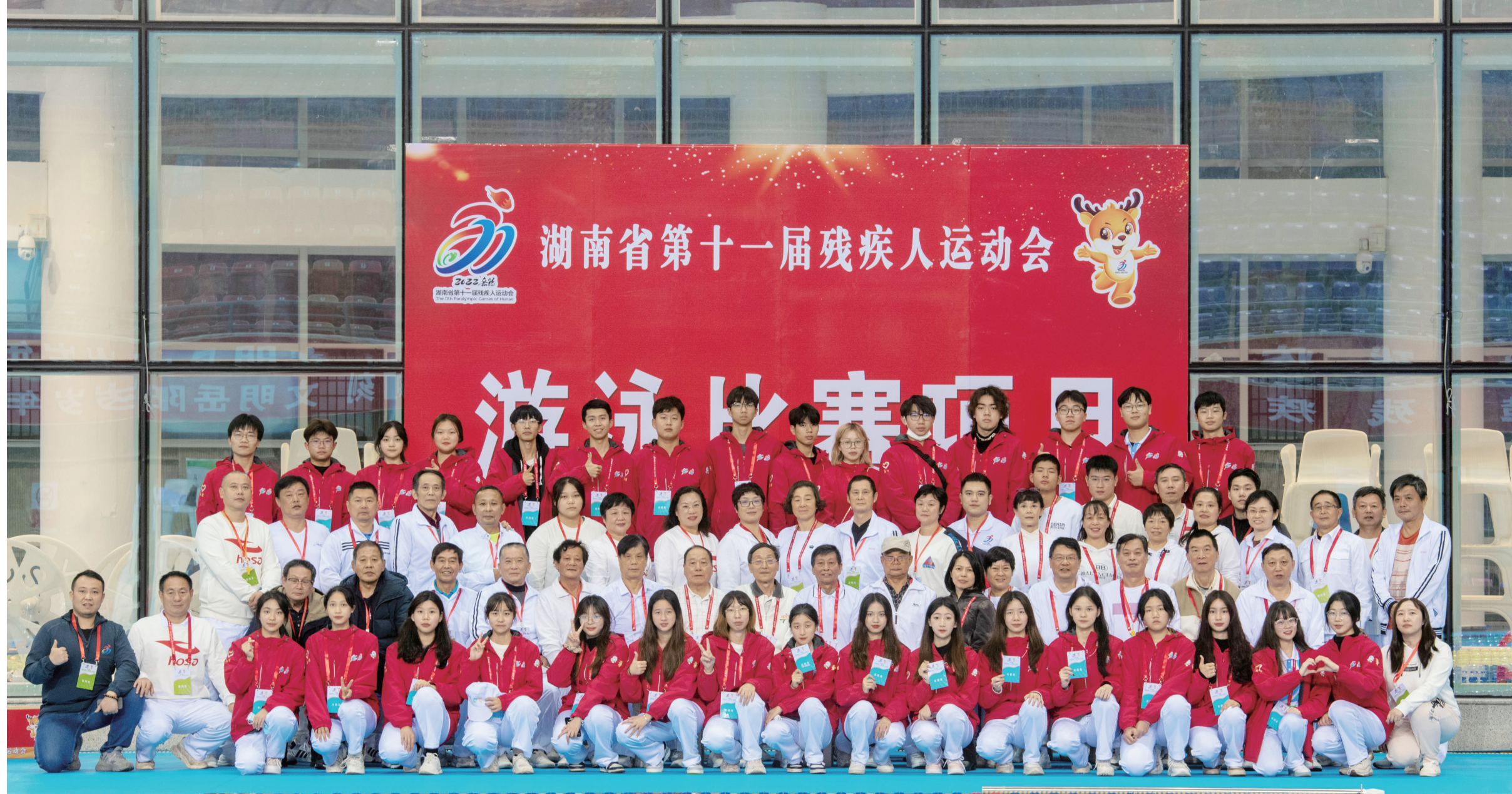
■ 2022 年 11 月 26 日，服务完湖南省第十一届残疾人运动会游泳比赛项目的湖南理工学院志愿者与裁判合影

湖南省内部资料准印字号 (湘F图) 2023033 2023 年 11 月 28 日出版