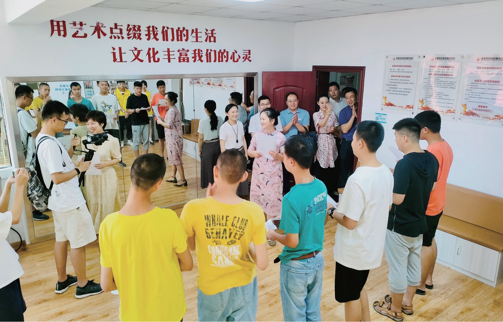
湖南理工学院新闻传播学院志愿者在南湖新区金锦社区开展关爱自闭症儿童志愿服务活动