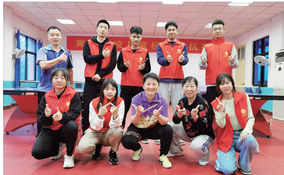
XIAO SHE QU CHENG JIU DA JING CAI 小社区成就大精彩

社区青春行动实施以来，湖南理工学院青年学子热情高涨，志愿服务蔚然成风”。校团委获评“全国五四红旗团委”荣誉称号。志愿服务工作先后受到新华社、《人民日报》《光明日报》《中国教育报》《中国青年报》《中国青年团》《湖南日报》等媒体报道。 ZINE