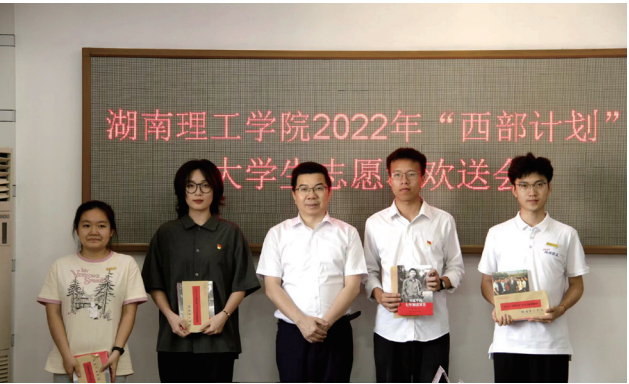
2022 年西部计划大学生志愿者欢送会

据统计，“西部计划”实施 20 年来，湖南理工学院共选拔近 500 名毕业生参加，其中 86% 分布在新疆、西藏、贵州等边远地区，1/4 以上的志愿者申请延期服务，近半数以上志愿者服务期满后选择扎根西部地区工作，学校 6 次被评为全国大学生志愿服务西部计划优秀项目。南疆地区面向内陆高校招录毕业生项目实施以来，该校共有 60 余名硕士研究生和本科生奔赴喀什、阿克苏、和田等地区基层就业，培养了一批“留得住、用得上、信得过、做得好”的青年基层骨干。 ZINE