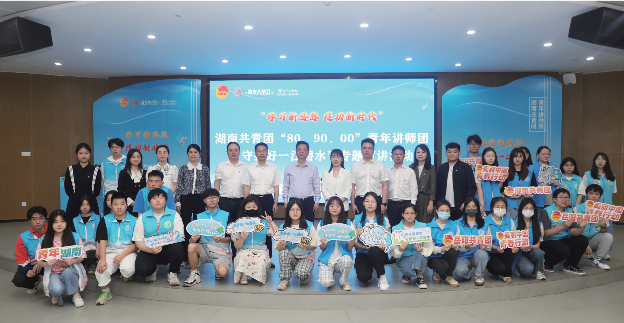
湖南共青团“80、90、00”青年讲师团“守护好一江碧水”专题宣讲活动在湖南理工学院举行