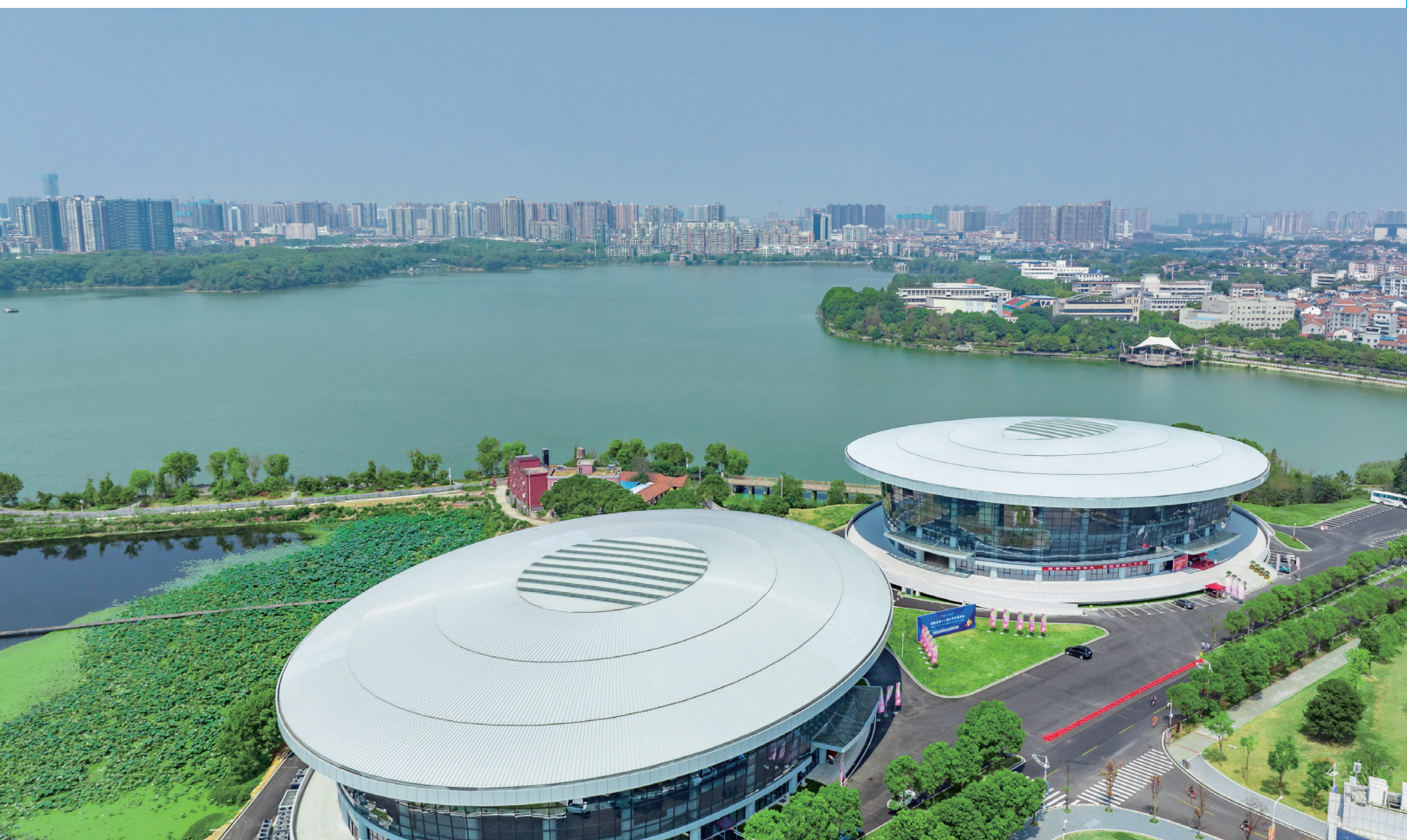
■ 封底摄影 / 徐皓宇