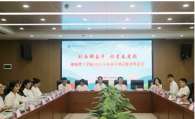
2023 年西部计划大学生志愿者欢送会